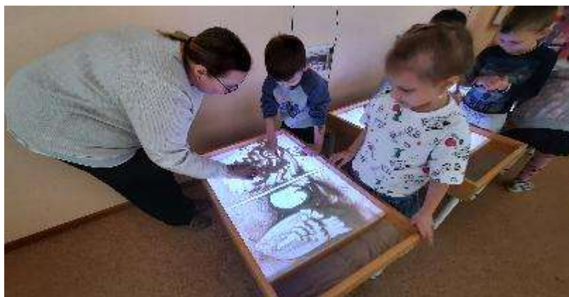
Подготовка к мультфильму «Баба Яга».