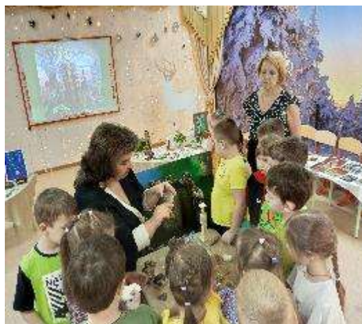
Выставка «Уральские самоцветы»

В 2024 году также совместно с МБДОУ «Детский сад № 131» г.о. Самара мы провели яркий, эмоционально-насыщенный и одновременно познавательный марафон – челлендж «Семейные коллекции».