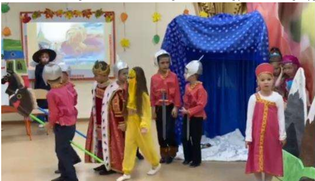
Фестиваль «Сказки Арины Родионовны»

В марте многие сады проводят фестиваль театрализованной деятельности и мы не исключение. За последние три года фестиваль посвящался сказкам А.С. Пушкина, басням ИА. Крылова, сказке П.П. Ершова «Конек-Горбунок». При подготовке к фестивалю дети вместе с воспитателями и родителями не только читают сказку, но и смотрят советские мультфильмы, рисуют иллюстрации, подбирают костюмы. Дети с миграционной историей наряду со всеми участвуют в этих фестивалях, приобщаясь таким образом к значимым произведениям русской литературы.